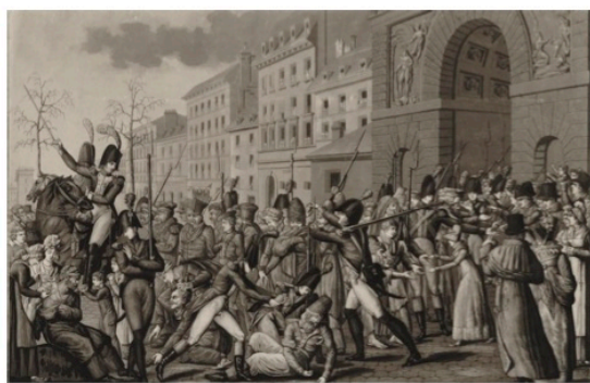
arrivée de prisonniers à Paris, février 1814